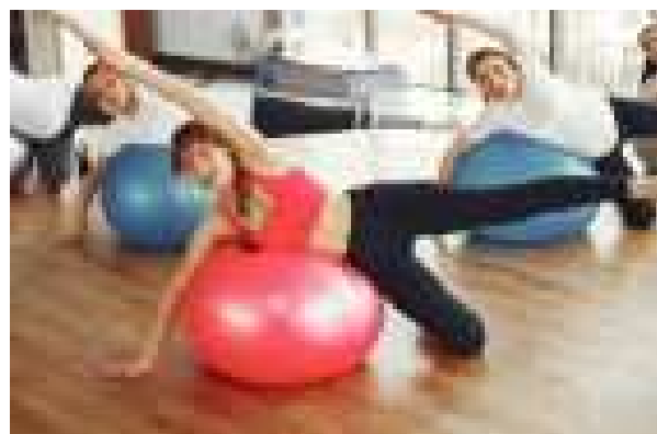
Pilates Vendredi 19h00 à 20h00