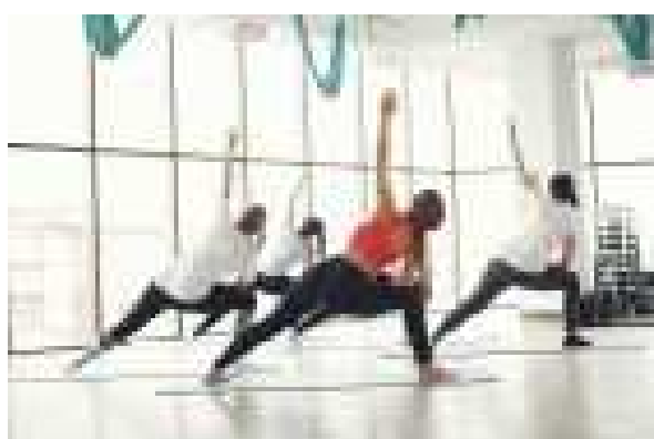
Gym Bien-être Jeudi 10h30 à 11h30