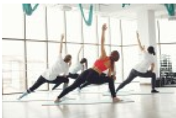
Gym Bien-être Jeudi 10h30 à 11h30