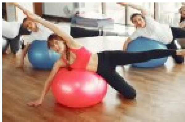
Pilates Vendredi 19h00 à 20h00